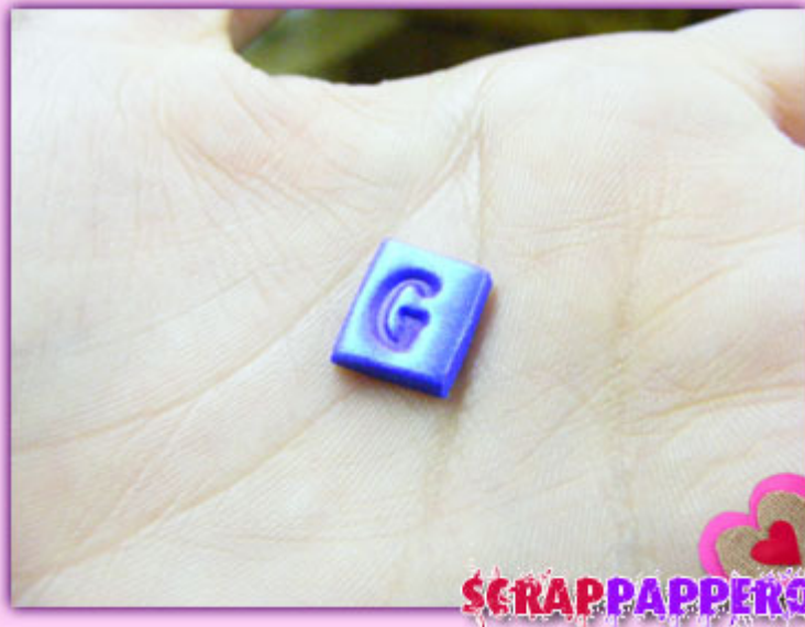
Particolare della lettera G con polvere metallizzante.