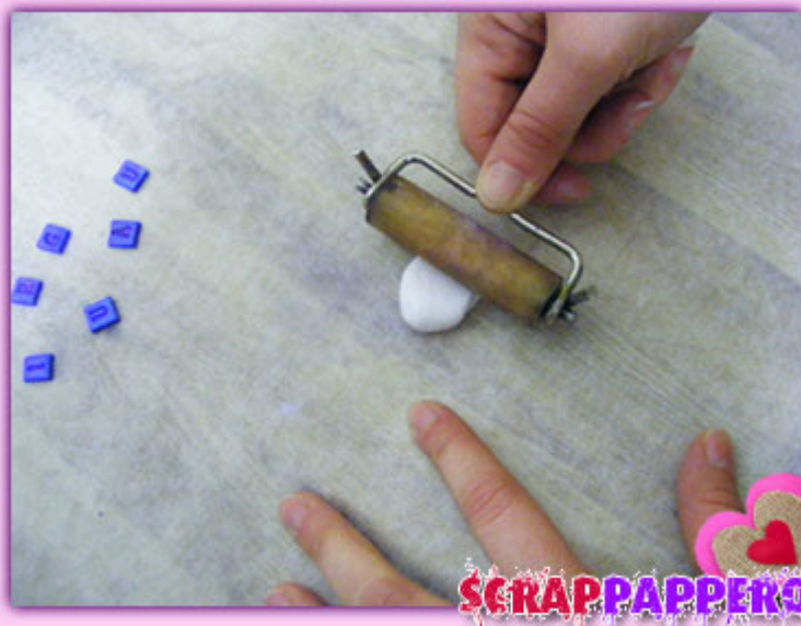
Creare lo sfondo con della pasta bianca o di altro colore preferito.